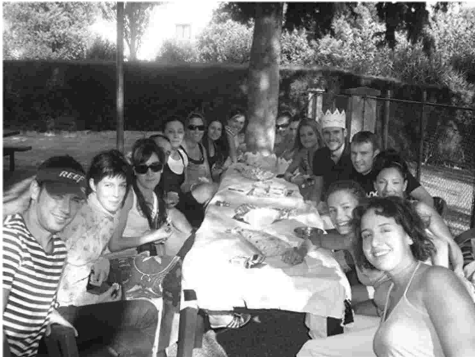
PEÑA LA TASKA